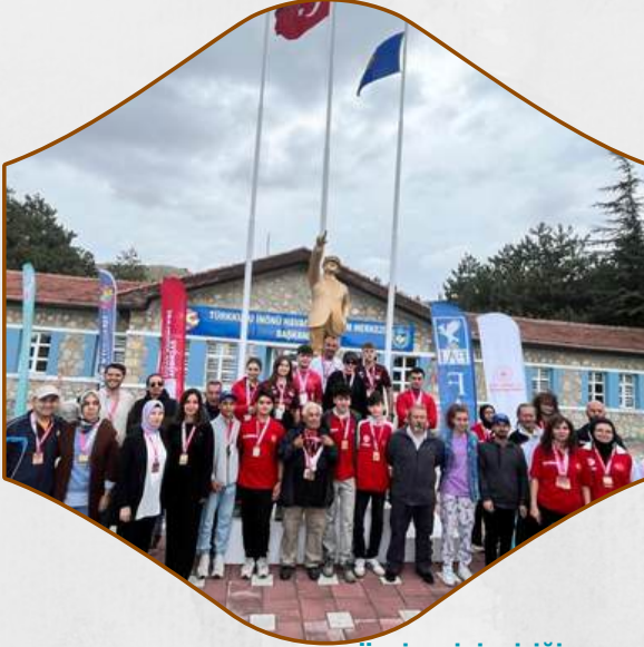
MODEL ROKET YARIŞMASI TÜRKİYE BİRİNCİLİĞİ