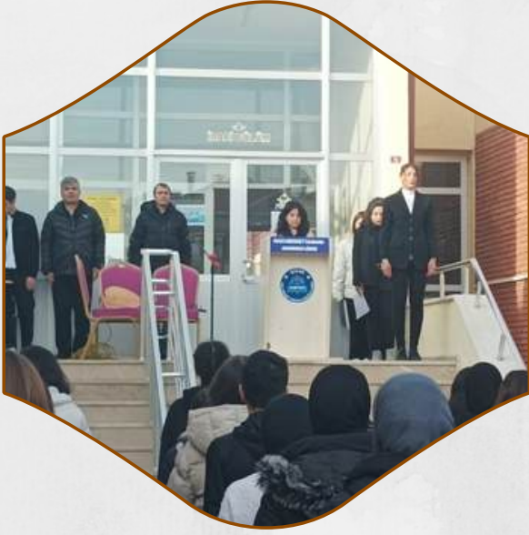
10 KASIM PROGRAMI