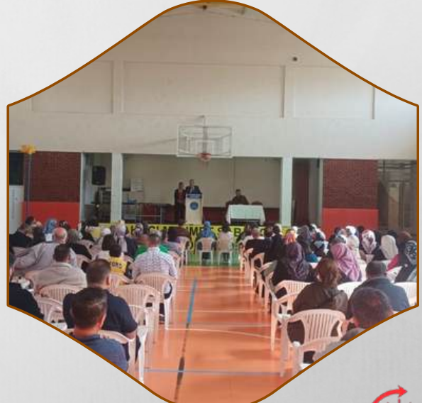
OKUL AİLE BİRLİĞİ TOPLANTISI