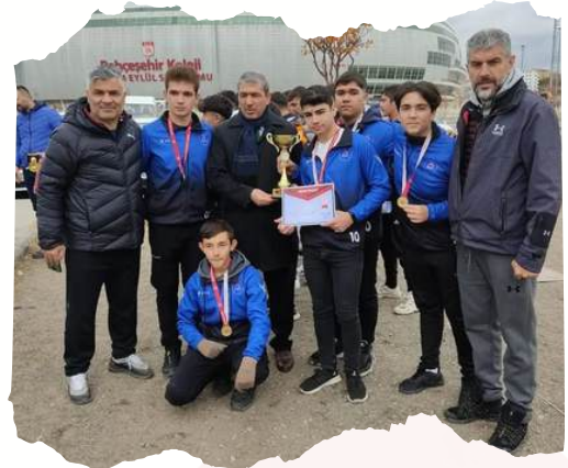
2022-2023 Üst üste 5.kez İl Birincisi Genç Erkek Takımımız

2022 – 2023 EĞİTİM ÖĞRETİM YILINDA YAPILAN BOCCE İL TURNUVASINDA KIZ TAKIMIMIZ İL DÖRDÜNCÜSÜ , ERKEK TAKIMIMIZ İL BİRİNCİSİ OLMUŞTUR.