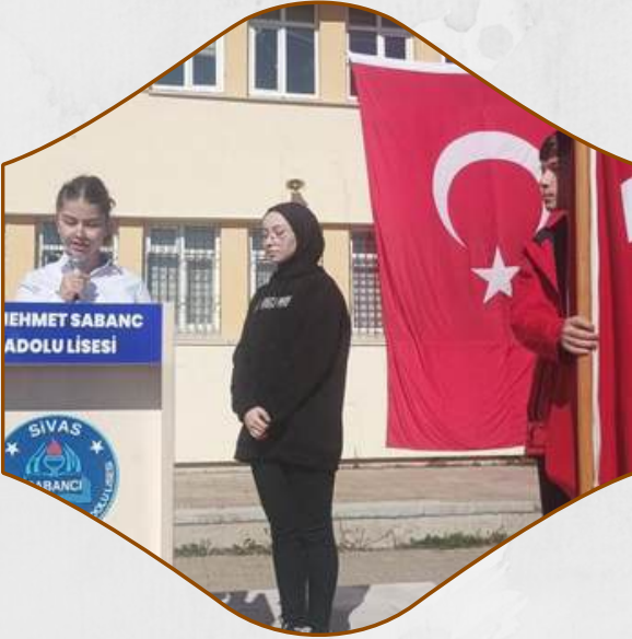
CUMHURİYET BAYRAMI PROGRAMI