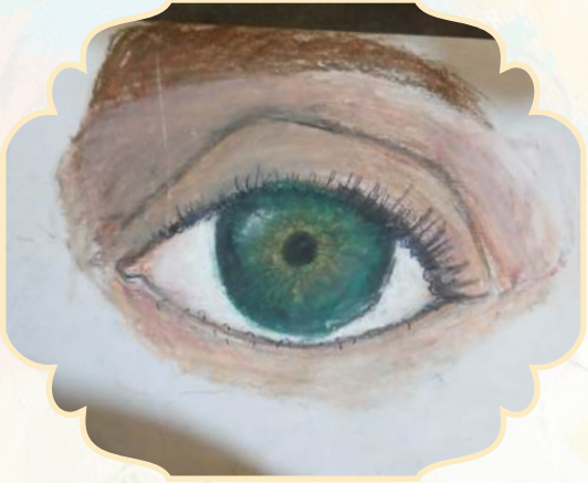
NAZLI GÖKÇE DUMLU