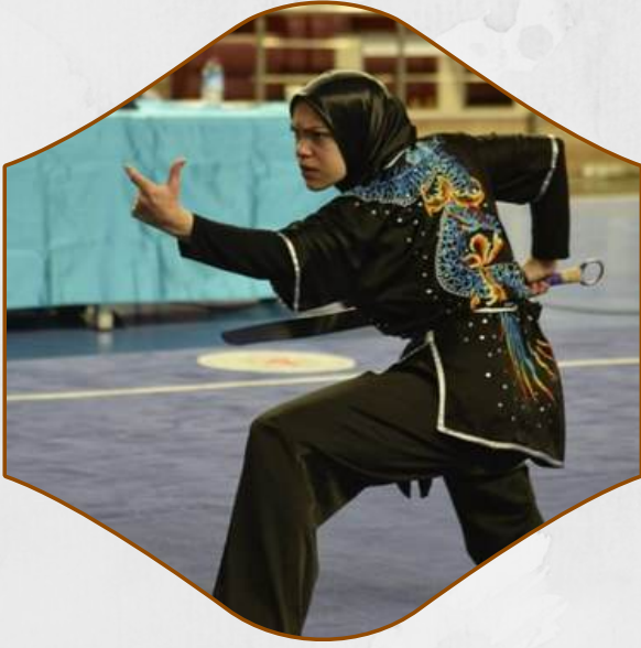
WUSHU TÜRKİYE BİRİNCİLİĞİ