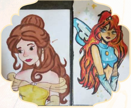
NAZLI GÖKÇE DUMLU