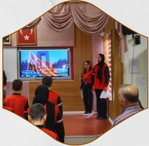
15 TEMMUZ PROGRAMI