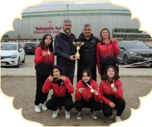
2022-23 il Birincisi Kız Takımımız

2014 – 2015 EĞİTİM ÖĞRETİM YILI BOCCE KIZ VE ERKEK TAKIMLARIMIZDAN İL BİRİNCİLİĞİ.