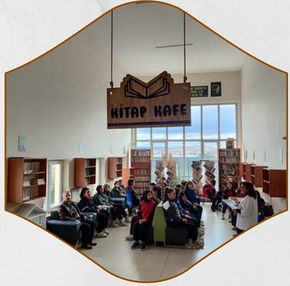
OKULUN KALBI KÜTÜPHANELER PROJESİ