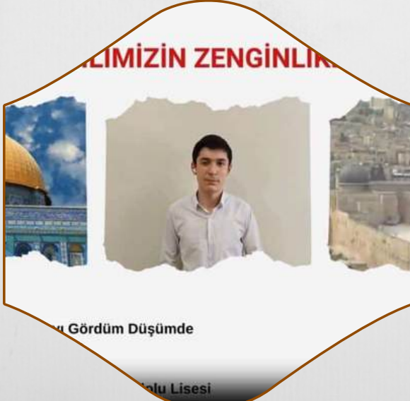
DİLİMİZİN ZENGİNLİKLERİ PROJESİ